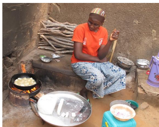
厚揚げを作るナイジェリアの女性

4人の文化人類学者が異文化と出会い、どのような疑問を持ち、どのようなことを考えたのか…。このことを知ることは、混迷しているように見える世界での私たちの羅針盤となるかもしれません。