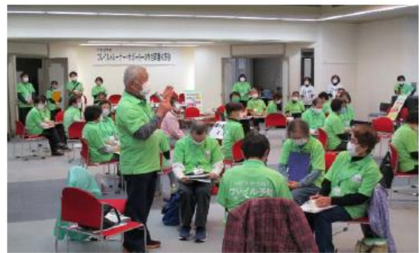
【フレイルチェック事業（フレイルサポーター養成研修）】