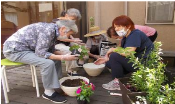
【小規模多機能型居宅介護（通所サービス）】