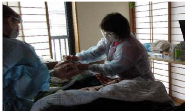
【訪問介護（ヘルパーによる身体介護）】