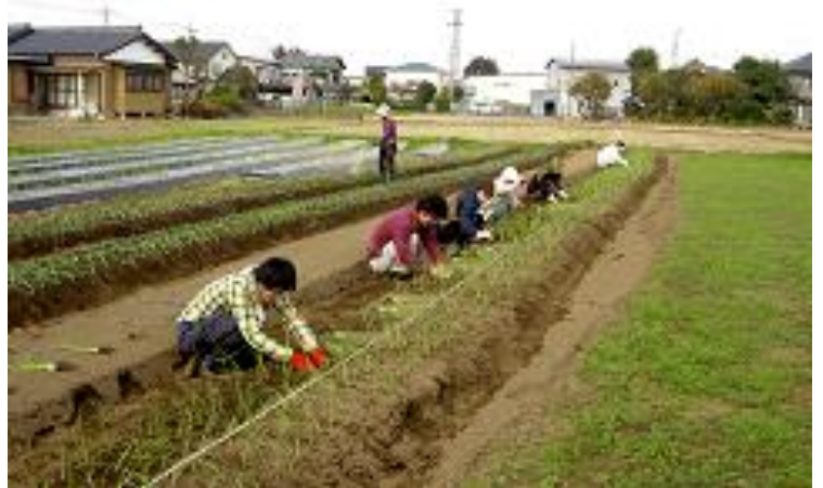
写真②；玉ねぎの定植

その後、難波田城公園内の金子家で、持参の弁当を食べながら、収穫祭の企画について話合った。